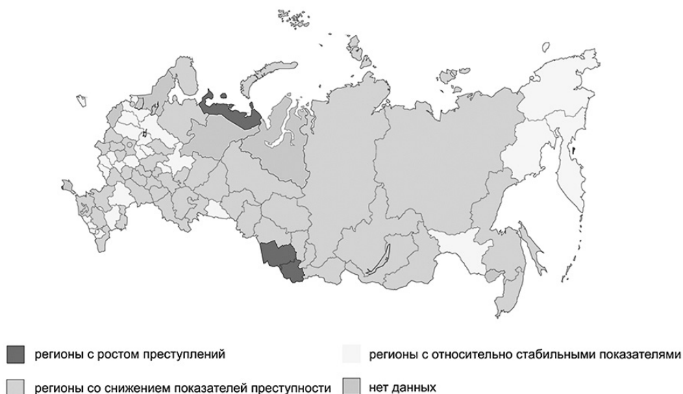
Рис. 2. Типология регионов России по динамике преступности несовершеннолетних за 2014—2016 гг. (по данным Генеральной прокуратуры РФ)